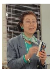
司会 (株)SSG こもだ 社長