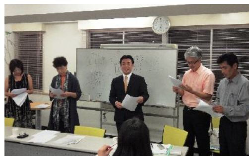
皆さま、なかなかの役者です。