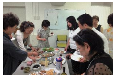
美味しいワインとカナッペ&チーズ！