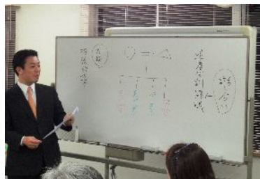
ご講演に熱の入る勝先生