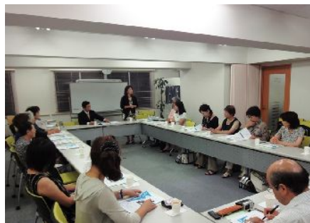
“第1回絆セミナー”参加者に感謝！